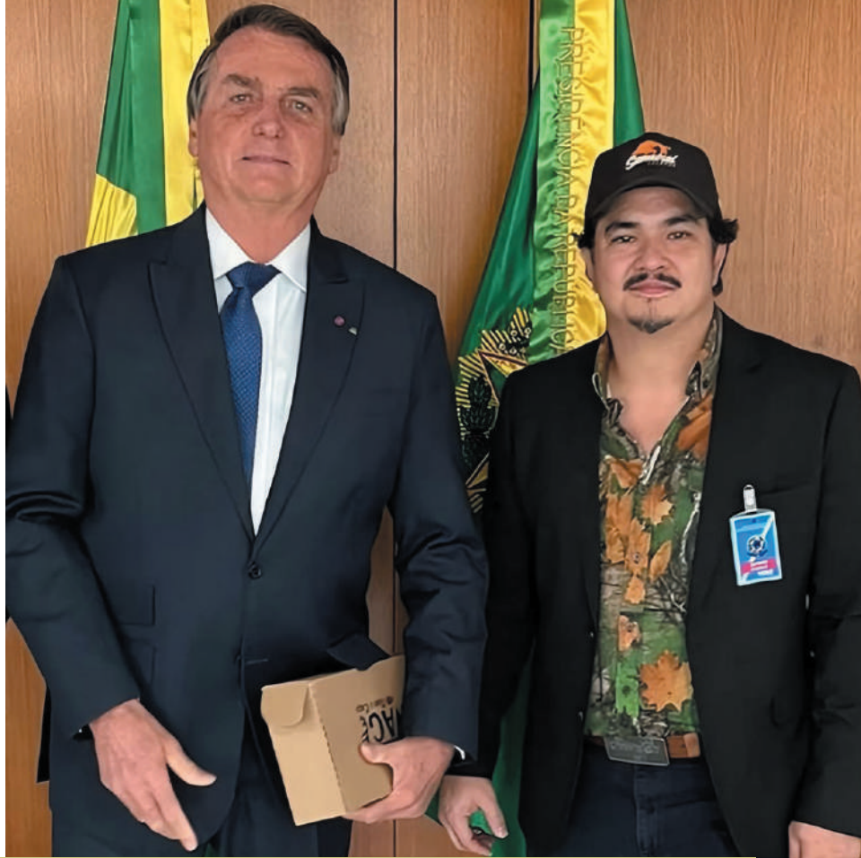
Trabalho - Ex-presidente Jair Bolsonaro e o Samurai.

“Bebedouro, a capital do cooperativismo, é importante no mapa do agronegócio paulista. O maior presente nesses 142 anos completados em 3 de maio é a garantia de que o investimento e, consequentemente, o desenvolvimento, podem fazer a diferença na vida dos moradores, fortalecendo a cidade como liderança regional. Parabéns, Bebedouro!”. (Samurai Caçador)