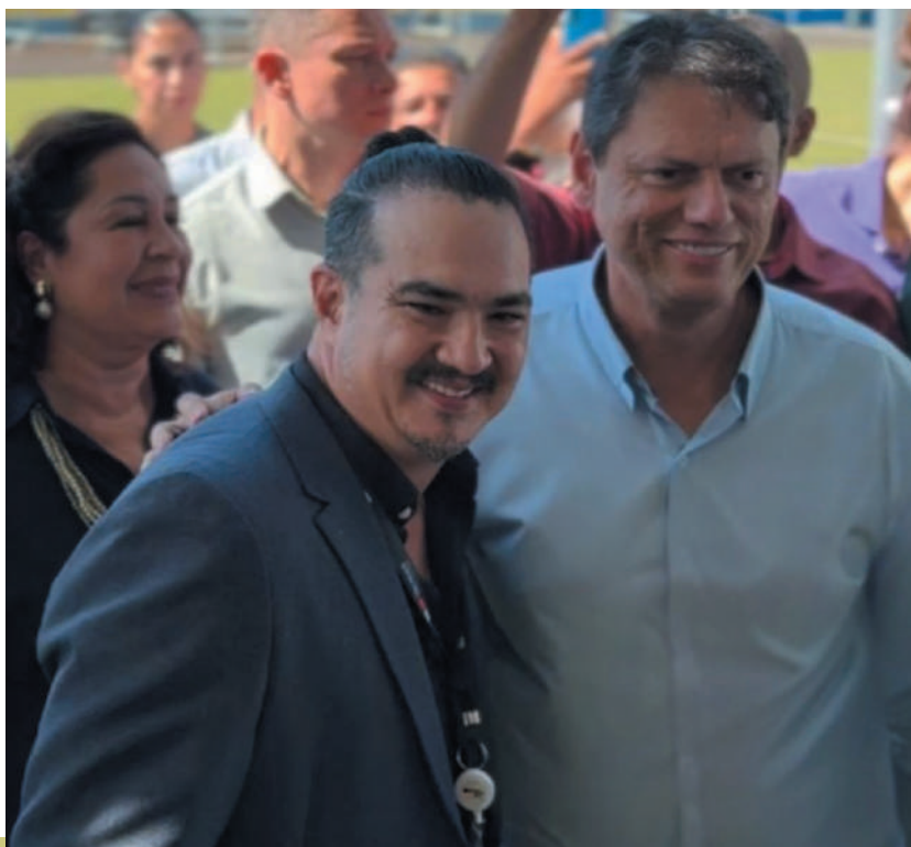
Confiança – Samurai Caçador e o governador Tarcísio de Freitas.

Sua atuação no cooperativismo e no agronegócio contribui para o fortalecimento da economia regional e a geração de empregos.