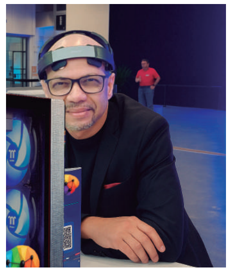
Inovação - Cabelo cria ferramenta para proteção de dados bancários e médicos.