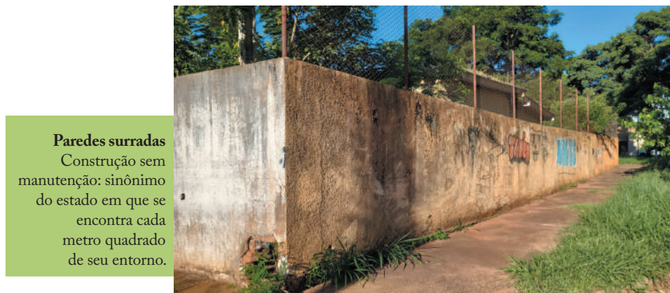
Paredes surradas Construção sem manutenção: sinônimo do estado em que se encontra cada metro quadrado de seu entorno.