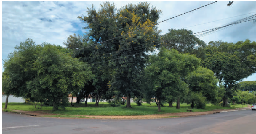
Verde nas alturas – De longe, parece organizada: árvores revelam que a praça existe faz tempo.

Outro diferencial é uma antiga construção de alvenaria, lacrada e sem visitas oficiais, sede de repartição da Cohab (Cia. Habitacional), depois abrigos de outros curtos usos. Quem habita agora cada conjunto de quatro paredes de tal prédio? Teias-de-aranha e animais peçonhentos que não perdem a oportunidade de edificar os próprios ninhos.