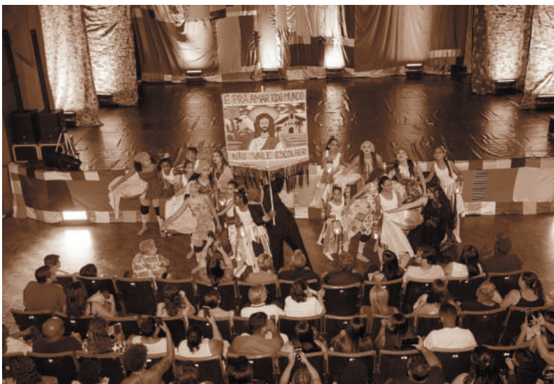
Visual impactante - Planejamento profissional de luz e som do Festival, todo executado pela M Produções.

“Cia de Dança Desiderata, projeto do ICDH, atende mais de 200 crianças e adolescentes, em Bebedouro”.