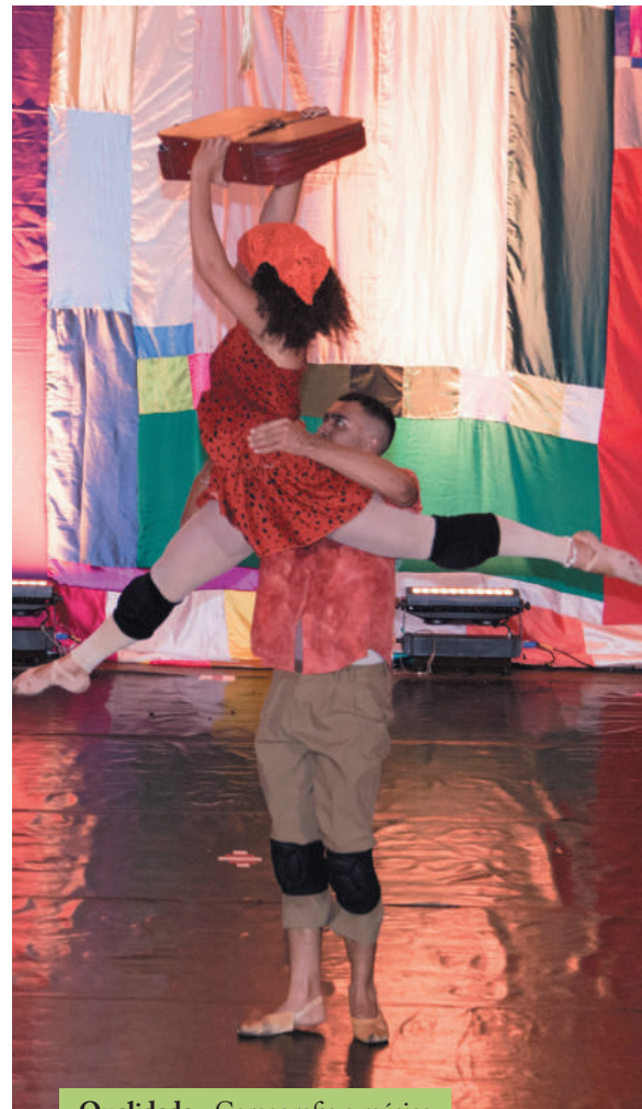
Qualidade - Coreografia e música evocaram memórias afetivas.