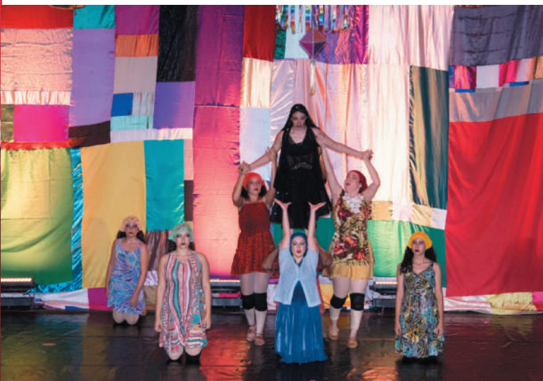
União - Força dos figurinos, cenários e adereços confeccionados manualmente por mães, responsáveis e voluntárias do projeto.