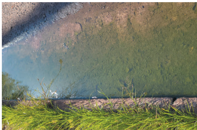
Fundo verde – A cor do lodo ao longo da guia de uma das calçadas indica que a água escorre por lá faz muito tempo.

Enquanto isso, a Domingos Ribeiro segue o seu martírio de desprezo e um certo abandono, com serviços de manutenção em câmara lenta. O tamanho das árvores revela a antiguidade, o mato raramente roçado esconde a falta de interesse de zeladores públicos, em meio à revolta de vizinhos e passantes.