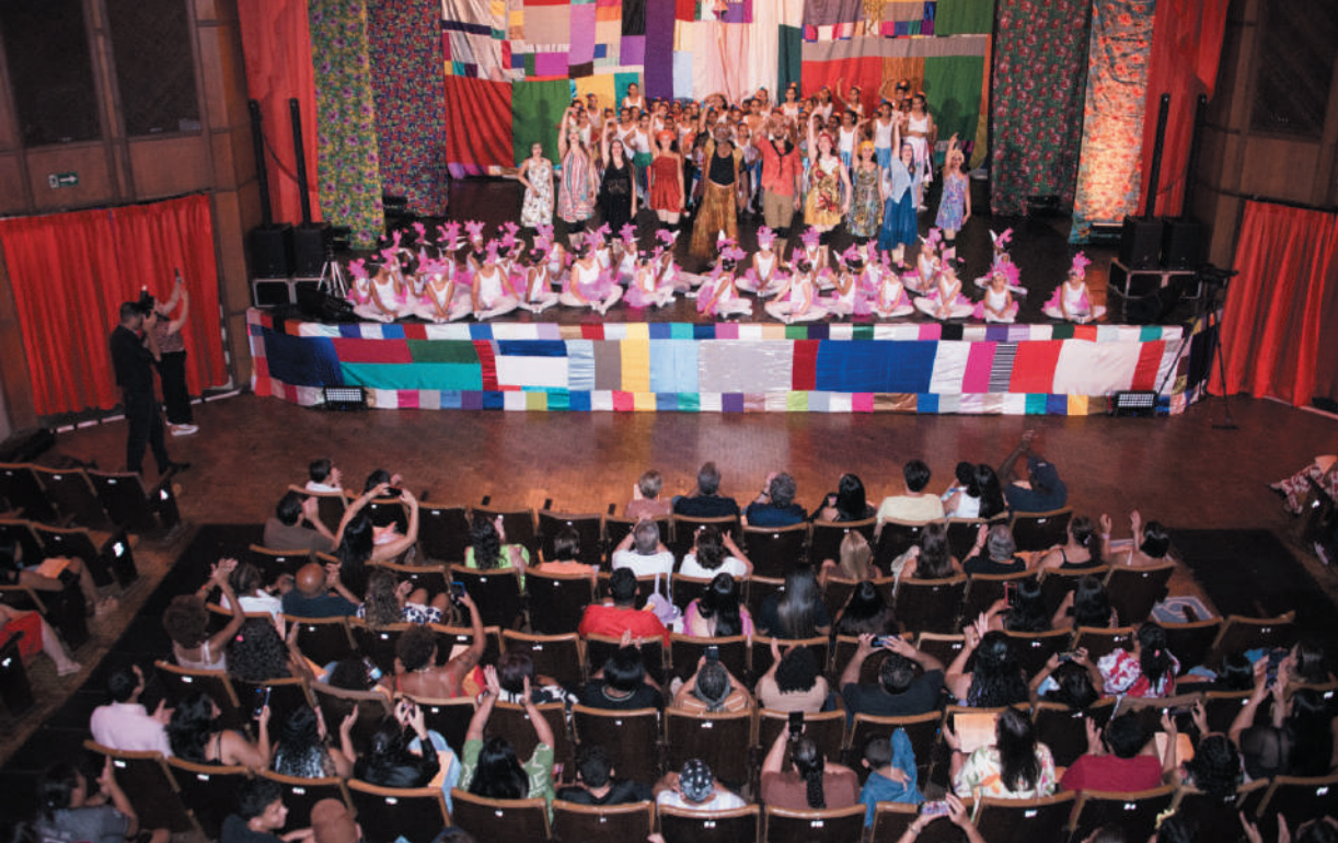
Casa cheia – Teatro lotado reforça importância do trabalho desenvolvido pela Cia de Dança Desiderata.