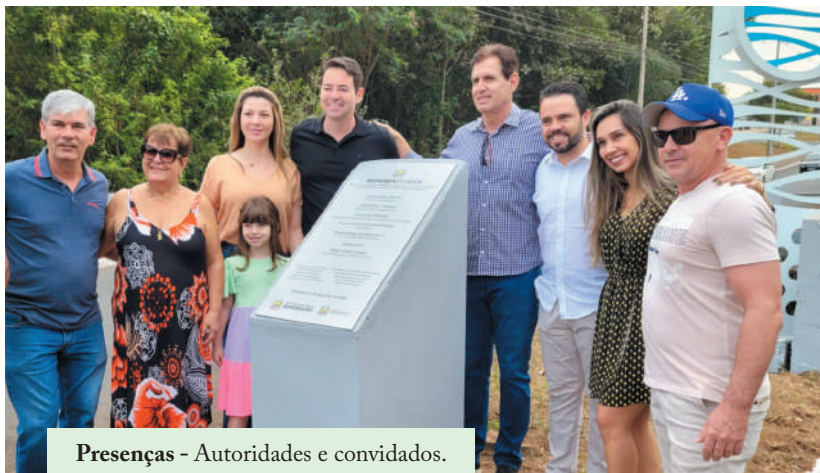
Presenças - Autoridades e convidados.