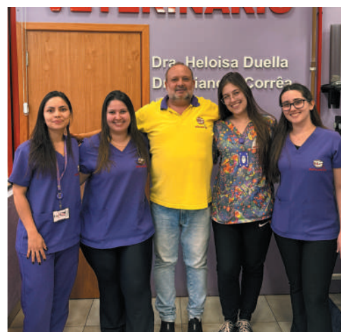
Expansão - Mercado Pet e os investimentos para oferecer mais serviços para seus bichinhos.