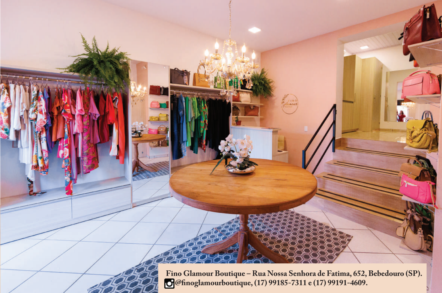
Fino Glamour Boutique – Rua Nossa Senhora de Fatima, 652, Bebedouro (SP). @finoglamourboutique, (17) 99185-7311 e (17) 99191-4609.

Referência em moda, do tamanho pp ao plus size, loja investe em coleções atemporais para atender a público diversificado.