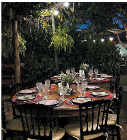
Ótima opção - Noites especiais no San Rufo!