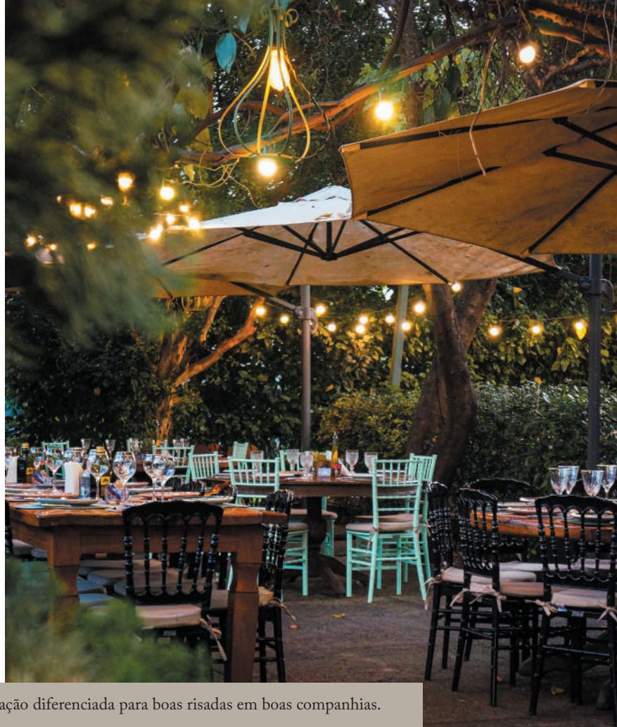
Ambiente externo – Contato com a natureza e iluminação diferenciada para boas risadas em boas companhias.

Ambiente interno Espaço confortável, climatizado e bem decorado: à espera de quem procura por boa gastronomia, conforto e privacidade.