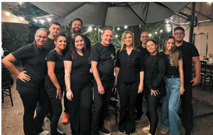
Nota mil – Equipe San Rufo: sempre atenta ao melhor atendimento.

A casa abre de quarta-feira a sábado, às 18h30. As delícias do restaurante também estão à disposição via delivery. É só ligar - e pronto!