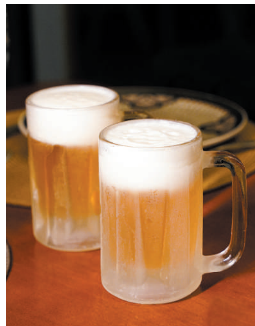
Bebidas – Entre as opções, chopp, drinks e os melhores vinhos.