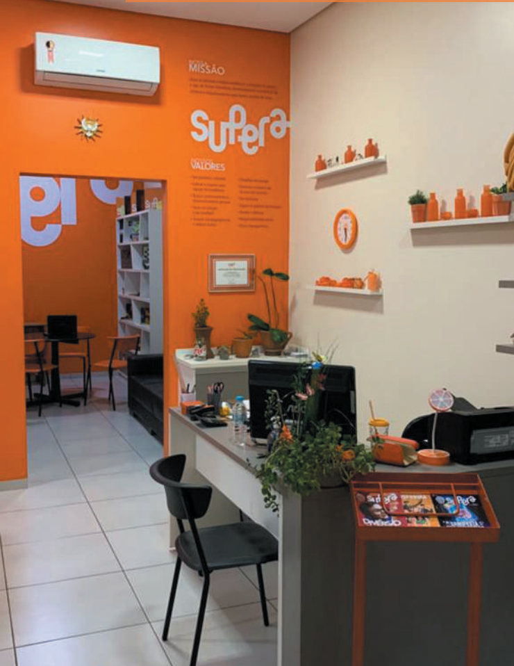
Recepção – A partir daqui, crescimento disciplinado.