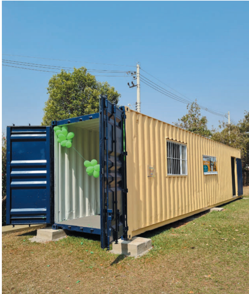
Destino correto – Na sede da Apae de Bebedouro, resíduos são armazenados em container adquirido com o apoio do Instituto Credicibus.

Os recursos arrecadados serão utilizados para a manutenção dos atendimentos diários da Apae. “Beneficiadas todas as 278 crianças, adolescentes e adultos com deficiências. A expectativa é de contar com as empresas, as escolas (municipais, estaduais e particulares), as igrejas e outros parceiros na difusão da importância da destinação correta dos resíduos eletrônicos e, conseqüentemente, destinar essas doações para os projetos da instituição”, observa a