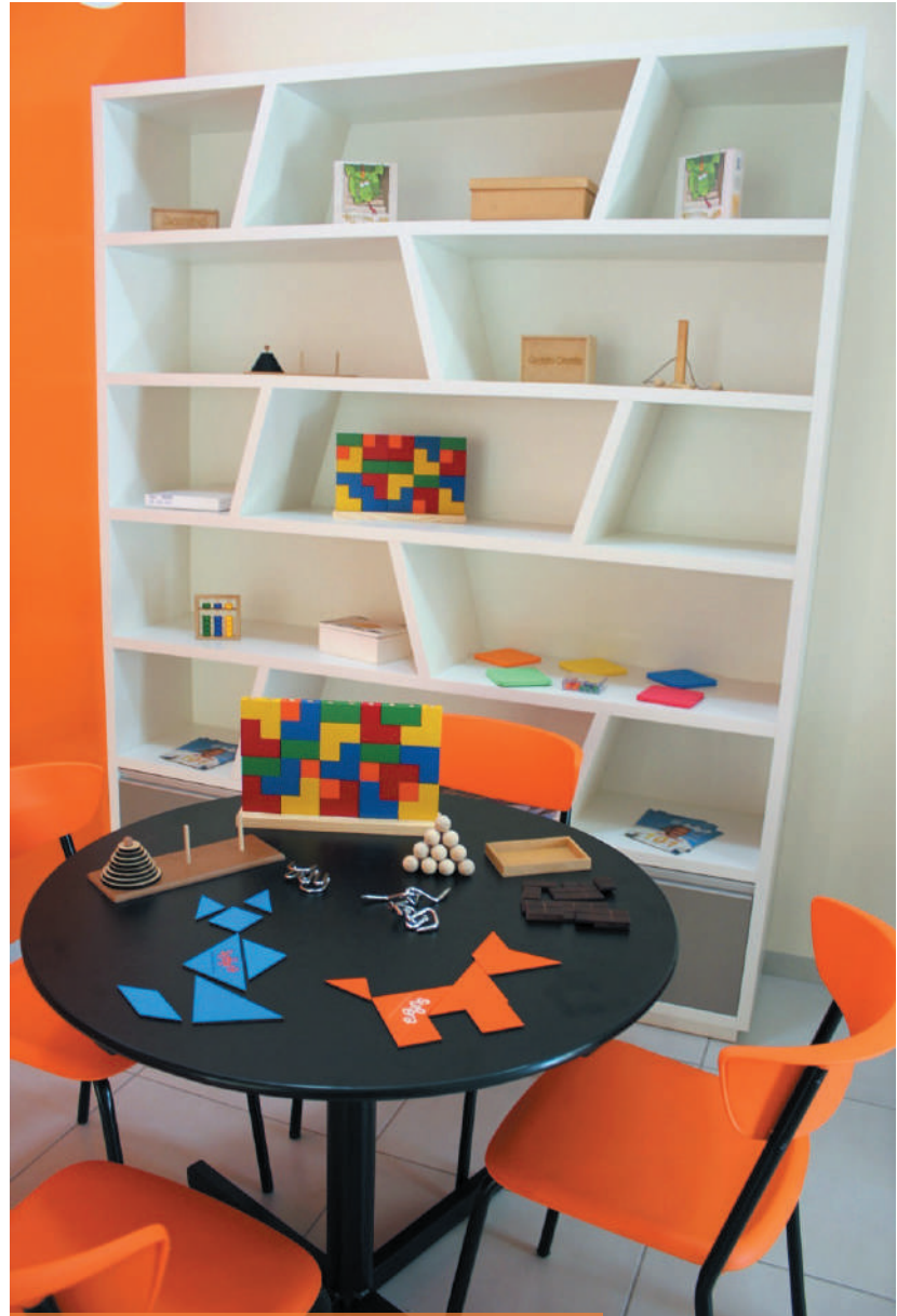
Criatividade – Tudo para você exercitar o cérebro.