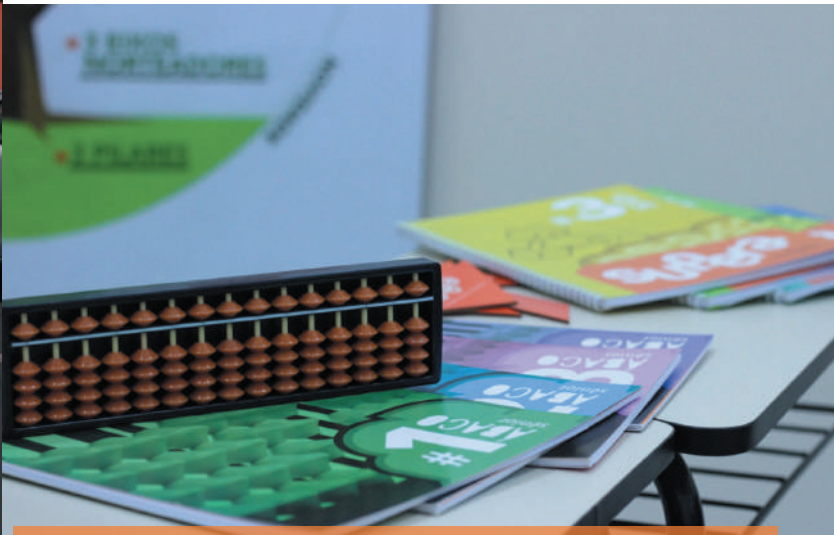
Material – De acordo com a proposta de melhoria de seu dia a dia.