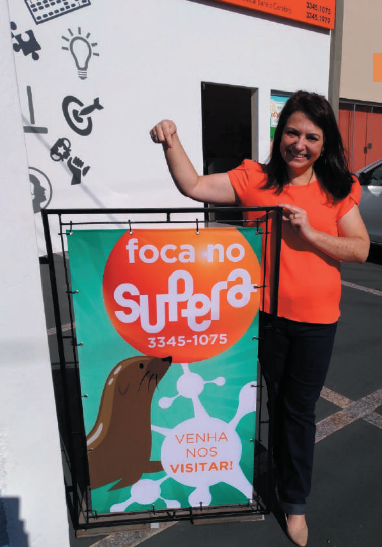
Foco – Experimente o Supera e viva a evolução de sua qualidade de vida.